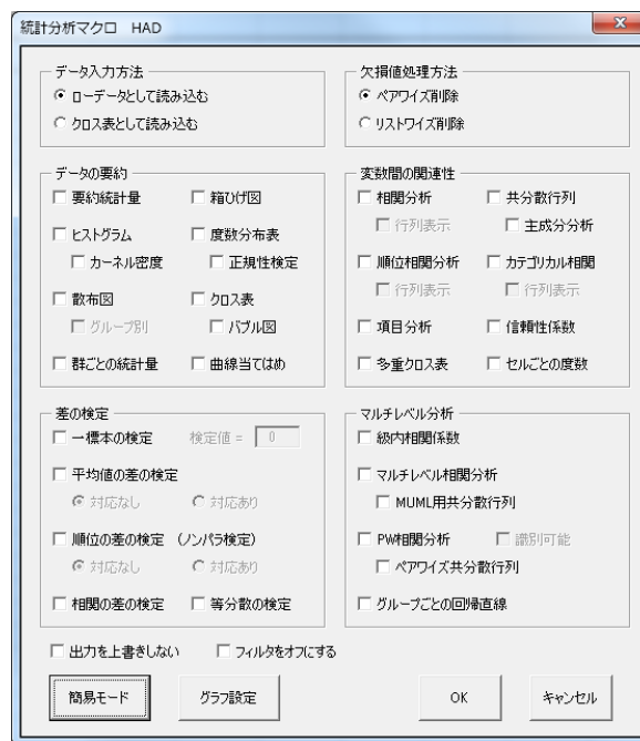
図 3 HAD の基礎統計分析機能

基礎統計分析には、大きく分けて 4 つの分類がある。図 3 のように、「データの要約」、「差の検定」、「変数間の関連性」、「マルチレベル分析」にカテゴリが分けられている。